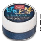
トリートメントオイル EAOL5S03 ¥1,000(本体価格)+税