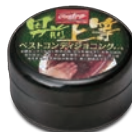
ベスト コンディショニングオイル EAOL5S02 ¥1,900(本体価格)+税