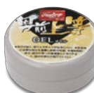
GELオイル EAOL5S01 ¥1,500(本体価格)+税