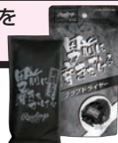
グラブドライヤー EAOL4S08 ¥400(本体価格)+税