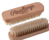
磨け ブラシ EAOL4F02 ¥800(本体価格)+税

革は乾拭きを繰り返すと中の油分が染み出してきて、 光沢が増し、表面の保護につながります。