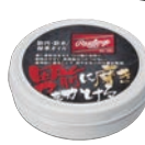
防汚・防水/ 保革オイル EAOL5S04 ¥850(本体価格)+税