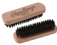
汚れを取れ ブラシ EAOL4F01 ¥700(本体価格)+税

グラブ革は微細な繊維が交絡している為、土・砂・ホコリが隙間に入り込んでいます。毛先の細い硬めの豚毛ブラシを汚れ取り専用ブラシとして使用してください。