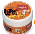
ストロング メンテナンス クリーナー EAOL4S01 ¥1,200(本体価格)+税