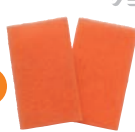
強力クリーナー スポンジ EAOL5S05 ¥500(本体価格)+税